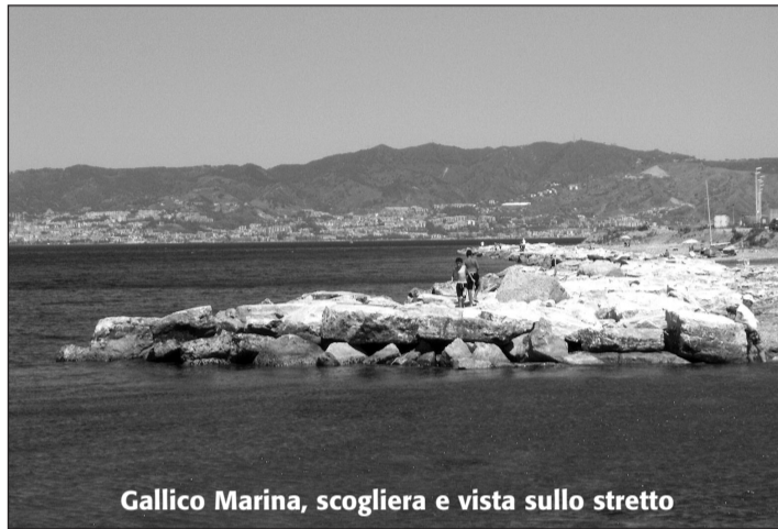
Gallico Marina, scogliera e vista sullo stretto

- Si è parlato anche di un consistente ritardo dovuto ad un infarto che aveva colpito il manovratore di un vostro macchinario.