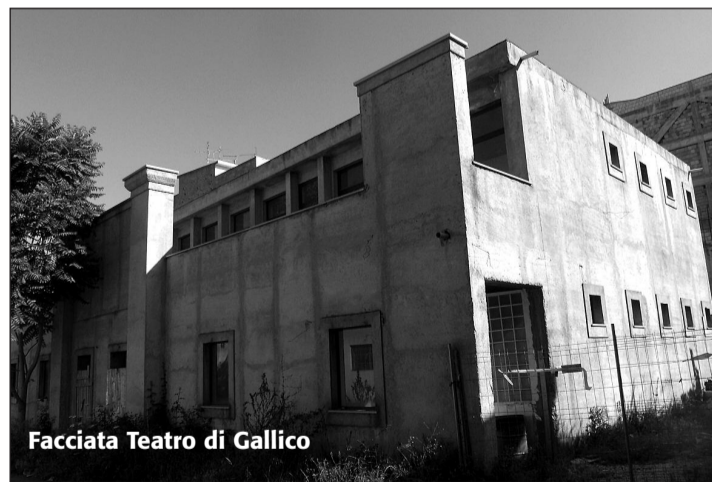
Facciata Teatro di Gallico