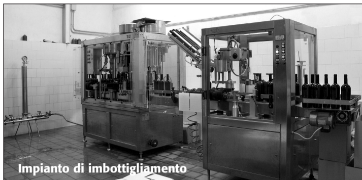
Impianto di imbottigliamento

Negli ultimi anni l'Azienda Tramontana ha ricevuto importanti ri-