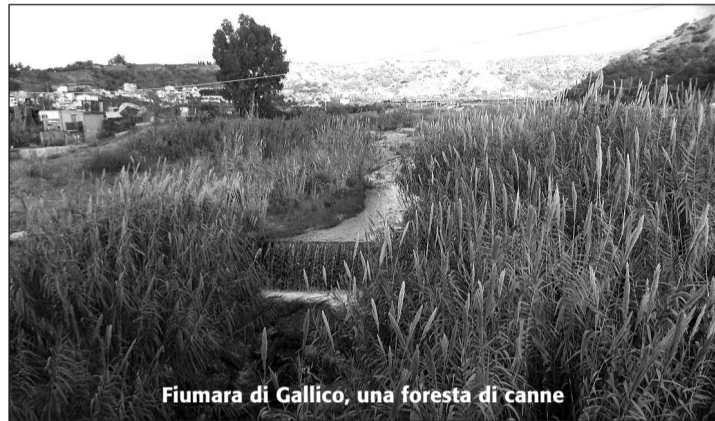
Fiumara di Gallico, una foresta di canne

Sul perchè non si sia dato inizio, a questi lavori, che potrebbero migliorare il nostro territorio, creando meno disagi per la cittadinanza e sotto qualche aspetto arricchirlo, con